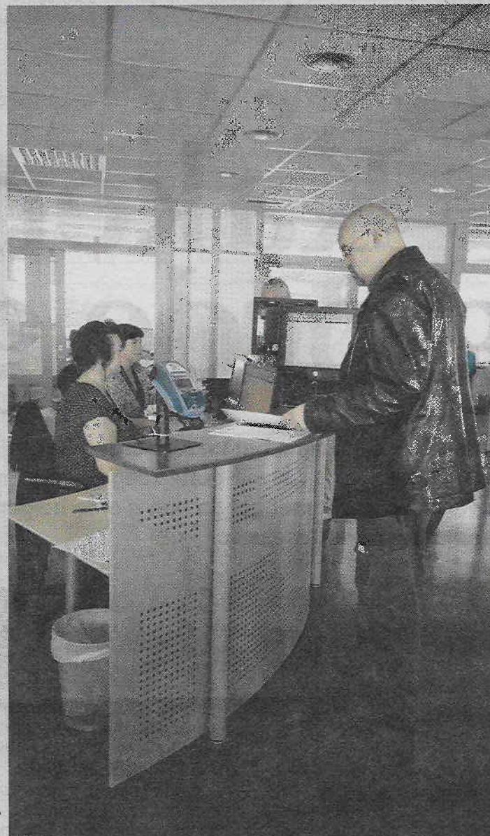
UTVIDET ÅPNINGSTID: Er det noe du lurer på i forbindelse med byggesak, oppmåling eller regulering har du nå en god mulighet til å få svar.

www.bergen.kommune.no/byggesak og www.bergen.kommune.no/arealplan .